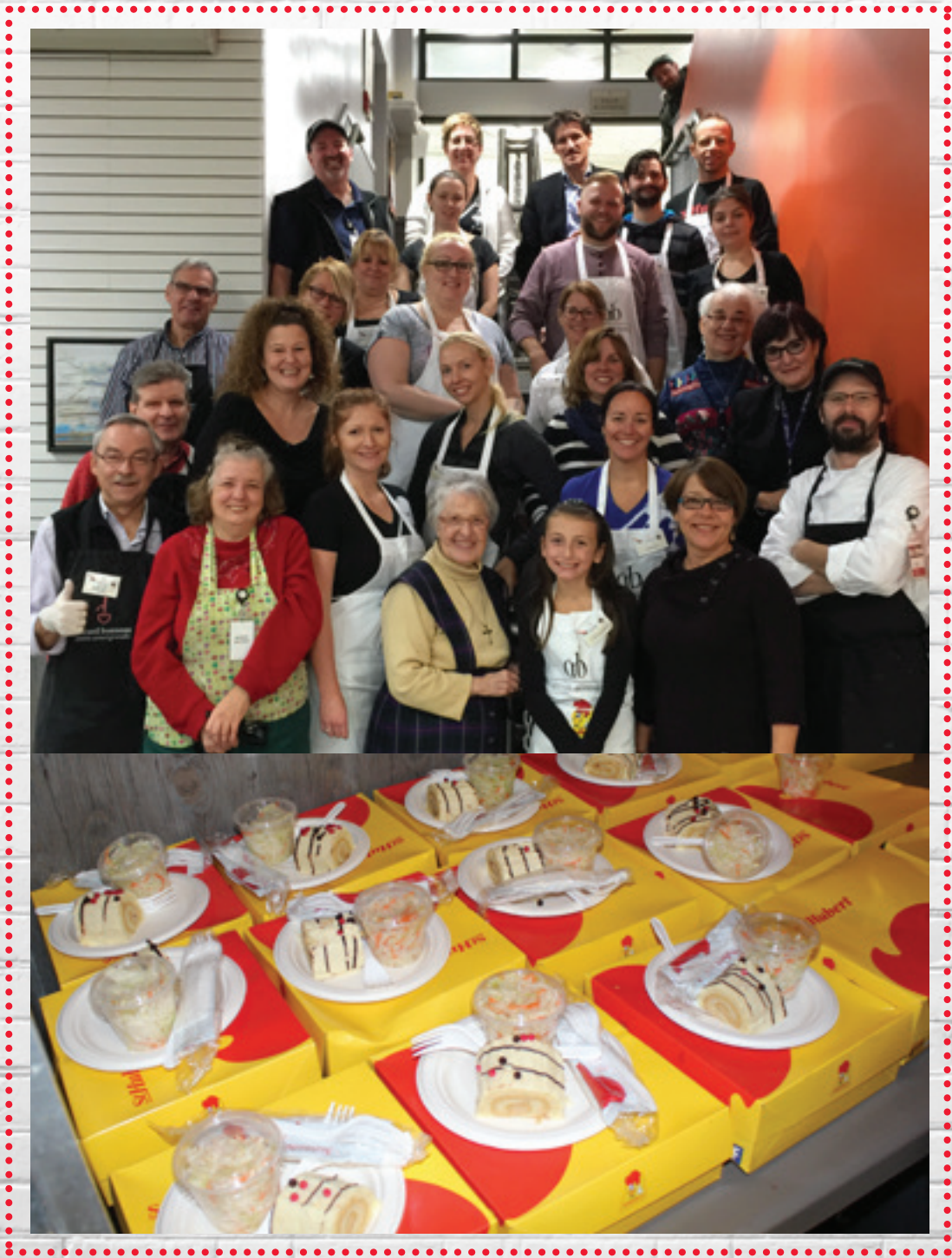
Les bénévoles de St-Hubert et de l'Accueil Bonneau lors de la 17 e édition de la distribution de repas.